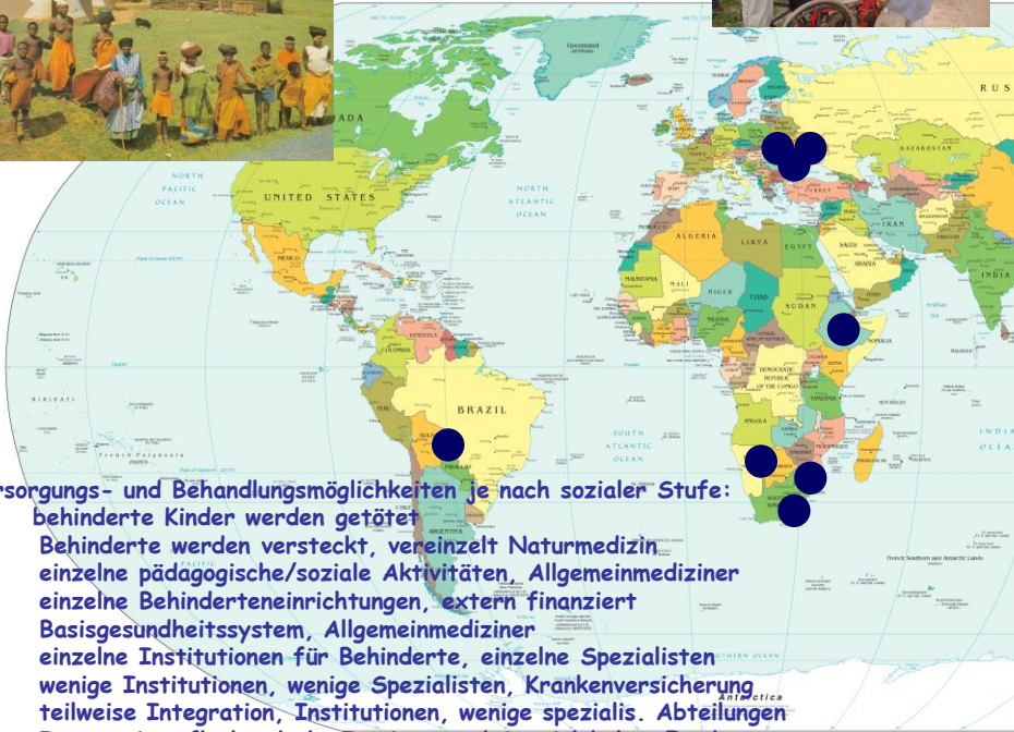
◆ 1996 Catovice Südpolen ◆ 1998 Lemberg Ukraine: Gründung von interdisziplinären Zentren für bewegungsbehinderte Kinder

Versorgungs- und Behandlungsmöglichkeiten je nach sozialer Stufe: